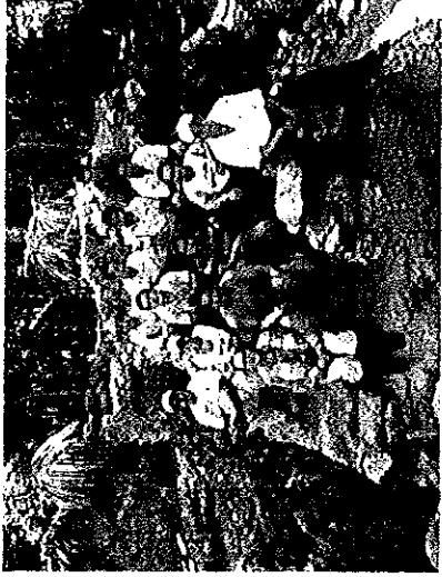
Personal de La Bolsa_ 2016